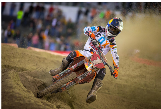
#1 ダンジー／450 SX

「スタートの失敗は予想外だったが、そのミスを取り返すために全力を尽くした。コースは前車をパスするのが難しく、レース序盤で順位を回復するのに時間が掛かってしまった。後半は集団が少なくなったことでペースを上げることができた。ポイントスタンディングス首位を維持するためにはレース戦略やマシンをさらに進化させなければならない。今はその進化を楽しみにしている」